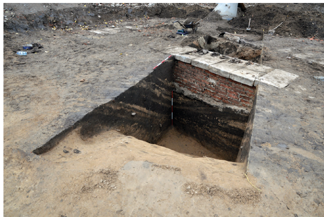
Obr. 38. Brno-Zábrdovice. Pohled na řez zasypanou úvozovou cestou. Zpracování I. Čižmář.

Profil úvozové cesty byl z východní strany narušen mladším zásahem souvisejícím s těžbou zeminy pro stavbu náspu přilehlé železnice.