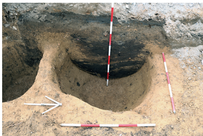
Obr. 16. Brno, Polní ulice. Zásobní jáma s. j. 501 s výplní zasahující do stěny stavební jámy.