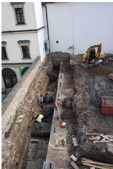
Obr. 10. Brno, Zelný trh 8. Pohled na plochu výzkumu.