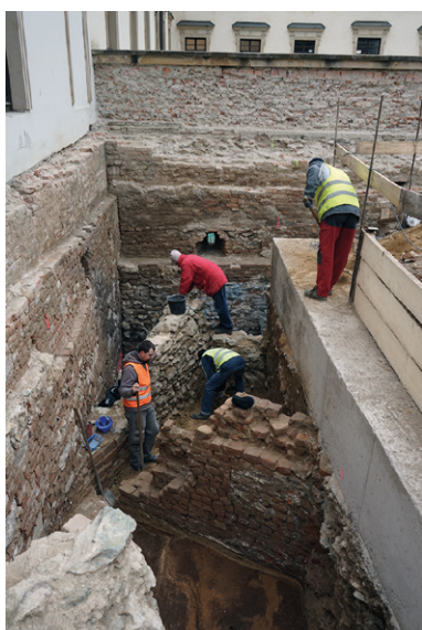
Obr. 11. Brno, Zelný trh 8. Začistování zachycené zděné zástavby.