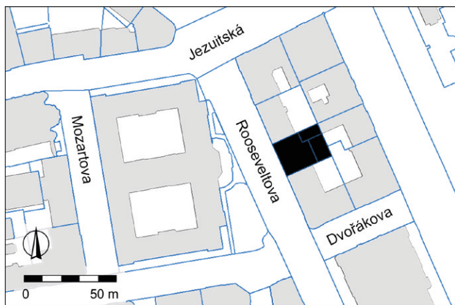
Obr. 8. Brno, ulice Rooseveltova 13. Vyznačení plochy staveniště. Zpracování Archaia Brno z. ú.

Záchranný archeologický výzkum byl vyvolán stavbou „Celková rekonstrukce objektu Rooseveltova 13“ (obr. 8). Terénní část výzkumu proběhla v letech 2018 a 2019. Sledované výkopy narušily kromě recentních uloženin, např. podkladových vrstev pochozích povrchů a zásypů inženýrských sítí, zejména zásypové