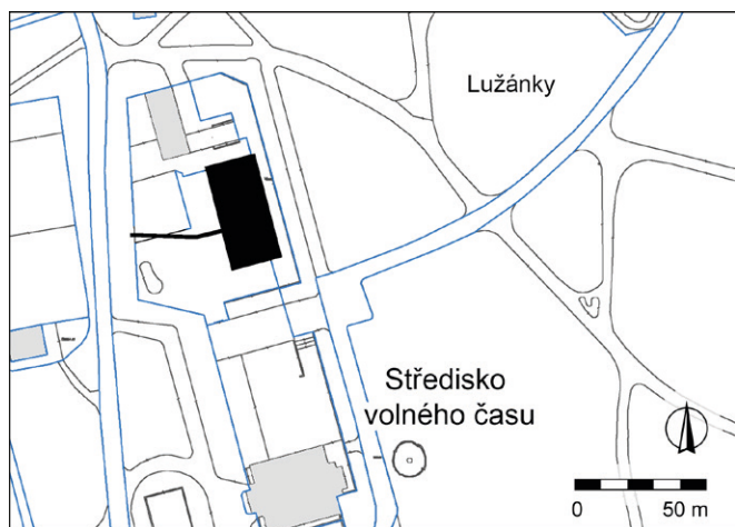
Obr. 1. Brno, ulice Lidická 50. Vyznačení plochy staveniště. Zpracování Archaia Brno z. ú.

Záchraný archeologický výzkum byl vyvolán stavbou výukového centra Lužánecký skleník (obr. 1). Celý prostor stavby se nacházel na sprašovém podloží s vyvinutým půdním horizontem. Místy byl povrch terénními zásahy srovnán a znovu navězen, patrně při historických parkových úpravách. Dokumentováno bylo několik zděných konstrukcí (základová zdiva, cihelné kanálky), nejspíše ze staveb, které náležely k původnímu vybavení parku (Zbranek 2019).