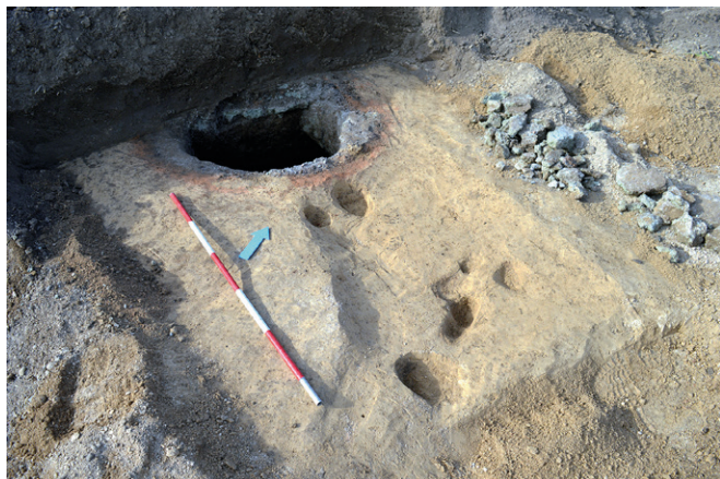
Obr. 2. Jiříkovice (okr. Brno-venkov). Hrnčířská pec.

Během liniové skrývky ornice pro rýhu II. etapy skupinového vodovodu Šlapanicko byla objevena a prozkoumána část menší hrnčířské jednokanálové pece z doby římské (obr. 2). Peciště obsahovalo mimo jiné také zlomky jemně tvrdě pálené keramiky jiříkovického typu. V okolí pyrotechnologického zařízení prozkoumány ještě dva další zahluobené kruhové objekty, jeden se zlomky keramiky z doby římské, svědčící o existenci sídliště.