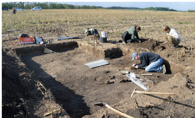
Obr. 13. Mohelno (okr. Třebíč). Kostrový hrob H11.