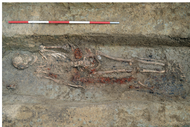
Obr. 7. Jiřkovic (okr. Brno-venkov). Kostrový hrob H804.

In: L. Belcredi a kol.: Archeologické lokality a nálezy okresu Brno-venkov . Brno: Okresní muzeum Brno-venkov, 141–168.