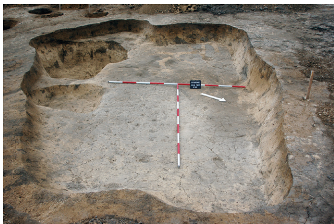
Obr. 5. Čelechovice na Hané (k. ú. Studenec), okr. Prostějov. Zahloubená chata z pozdní doby laténské (obj. č. 512/2019). Foto P. Fojtík.

Abb. 5. Čelechovice na Hané (Kat. Studenec), Bez. Prostějov. Grubenhäuser (Latènezeit Stufe D, Obj. Nr. 512/2019). Foto P. Fojtík.