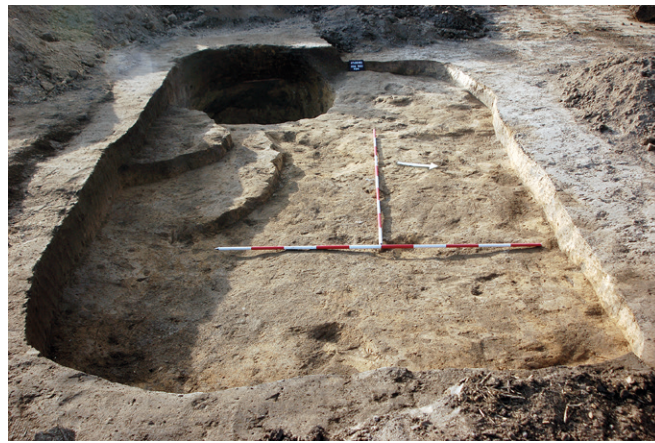
Obr. 6. Čelechovice na Hané (k. ú. Studenec), okr. Prostějov. Zahloubená chata z pozdní doby laténské (obj. č. 541/2019). Foto P. Fojtík.

Abb. 5. Čelechovice na Hané (Kat. Studenec), Bez. Prostějov. Grubenhäuser (Latènezeit Stufe D, Obj. Nr. 512/2019). Foto P. Fojtík.