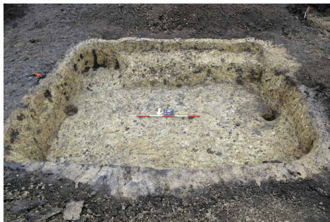
Obr. 2. Blažovice. Zahloubená chata po exkavaci.