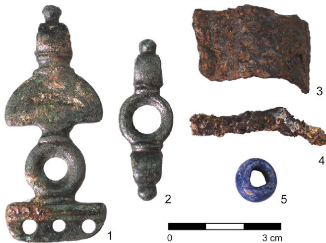
Obr. 3. Blažovice. Výběr drobných nálezů.