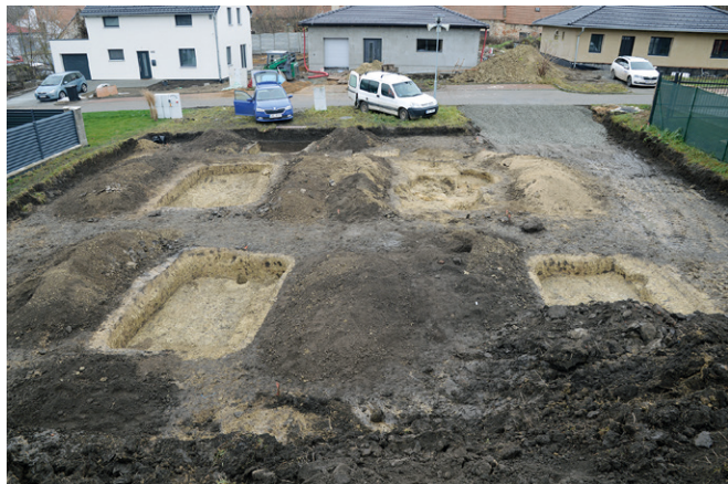
Obr. 1. Blažovice. Pohled na zkoumanou ploÙu.

Záchraný archeologický výzkum probíhal v rámci stavby rodinného domu p. DiviÙe. Polohu je možné určit na ZM ČR 1 : 10 000, list 24-42-02, v ploÙe mezi body 387/35, 387/37, 389/37, 389/35 mm od Z/J s. č. Ve skryté ploÙe se v geologickém podloží podařilo rozpoznat půdorysy celkem pět zahloubených chat z doby laténské (obr. 1). Tři z nich byly prozkoumány celé, dvě zabíhaly částečně mimo zkoumanou ploÙu. Jednalo se o klasické zemnice s dvěma kůly na středové ose, některé z nich byly opatřeny tzv. lavicemi (obr. 2). Výplň objektů poskytl četné zlomky keramiky a zvířecích kostí, nechybí ovšem také úlomky železných strusky. Z drobných nálezů se podařilo získat zlomky železných spon, dva bronzové články opasku a skleněný korálek (obr. 3). Právě nálezy spon spolu s keramikou datují situaci do stupně LT C1 podle relativní chronologie, tj. cca mezi léta 260–160 př. n. l. Keramika z některých chat je