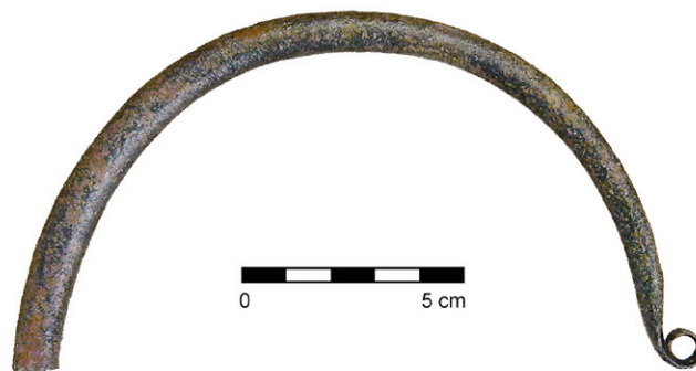
Obr. 6. Horka nad Moravou. Část měděné hřivny.