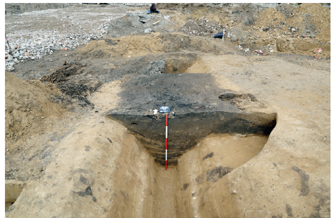
Obr. 4. Brno-Zábřovice. Pohled na profil segmentu příkopu.