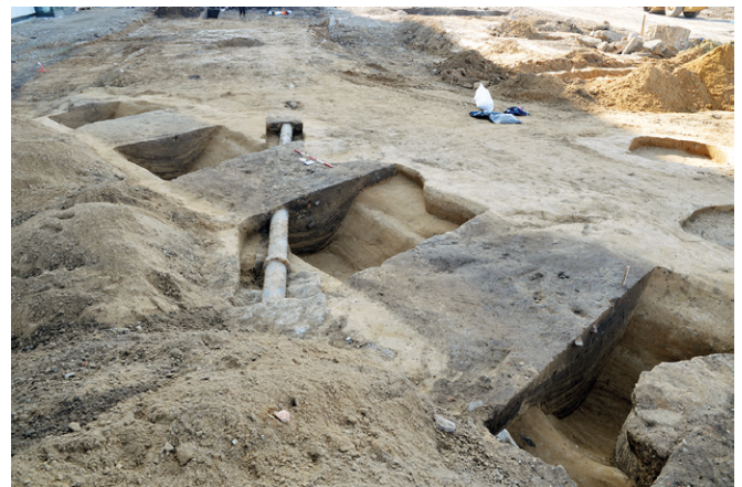
Obr. 3. Brno-Zábřovice. Pohled na část příkopu, který porušoval objekty z mladší doby bronzové.