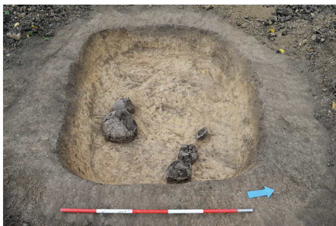
Obr. 3. Jiříkovice (okr. Brno-venkov). Hrob kultury se šňůrovou keramikou.