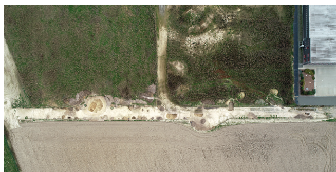
Obr. 4. Otice (k. ú. Rybníčky, okr. Opava). Pohled na výzkum z ptačí perspektivy (snímek pořízen pozemním vrtulníkem DJI PHANTOM 4 PRO+).

Soňa Králová, Jiří Juchelka, Ondřej Klápa