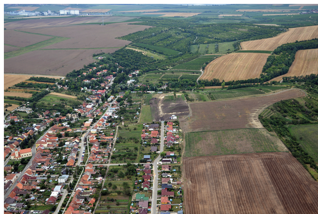
Obr. 6. Starovice (ok. Břeclav). Letecký snímek lokality, pohled od severu.

Před vlastní antropogenní aktivitu lze datovat různé geologické pochody (patrně erozní, svahové apod.), díky kterým se původně značně členité jílovité podloží zarovnilo a zaplnilo několika depresí, vývratů a terénních nerovností. Tento jev nebylo snadné bez exkavace jednoznačně interpretovat. K tomuto problému bylo přistupováno z hlediska archeologie jako k zahloubeným kontextům a odpovídá tomu i číslování objektů a uložení. Jde tak např. o objekty číslo 500, 578, 592, 606, 607 atd., a zejména objekt číslo 598, kde uloženina/vrstva 205 zabírá celý střed zkoumané plochy.