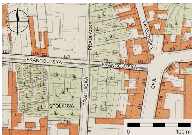
Obr. 4. Brno, Francouzská. Průběh rekonstruované kanalizace (šrafurou; dvojitá šrafura; podrobně sledovaný úsek). Podkreslen plán z roku 1885 (Archiv města Brna, fond U9, signatura K42).

V roce 2019 bylo ukončeno zpracování záchraného archeologického výzkumu, který při rekonstrukci kanalizace a vodovodu na ulici Francouzské v Brně realizovala společnost Archaia