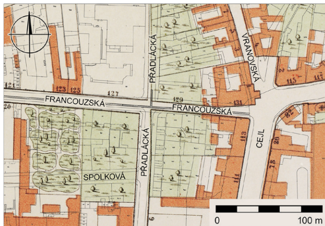
Obr. 4. Brno, Francouzská. Průběh rekonstruované kanalizace (šrafurou; dvojitá šrafura; podrobně sledovaný úsek). Podkreslen plán z roku 1885 (Archiv města Brna, fond U9, signatura K42).

V roce 2019 bylo ukončeno zpracování záchraného archeologického výzkumu, který při rekonstrukci kanalizace a vodovodu na ulici Francouzské v Brně realizovala společnost Archaia