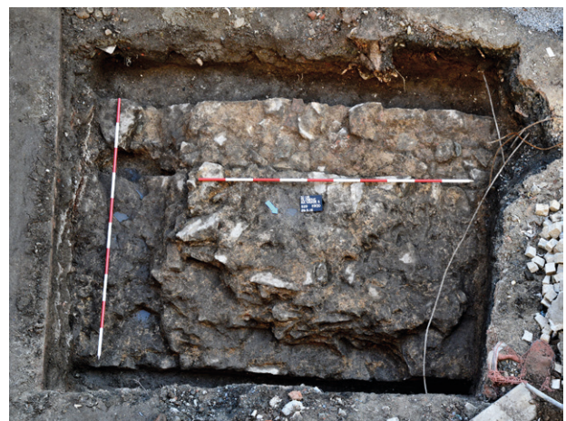
Obr. 77. Olomouc, Na Hradě. Základové zdivo hradby v sondě S29/18, celkový pohled.

Ve sklepních prostorách budovy bylo položeno celkem 19 nestejně velikých sond (sondy S2/17 až S20/17). Rozlohou jednou z největších (3,70 × 6,10 m) byla sonda S3/17 nalézající se v severní části budovy. Postupnou exkavací novodobých vrstev zde byla preparována torza nadzemních a základových zdí budov, jejich stáří spadalo do období pozdního středověku až novověku. V průběhu skrývání okolních uloženin byl zjištěn do skály zasekaný výkop pro mladohradištní kostrový hrob HR1/17, v němž spočívala část lidského skeletu v natažené poloze a orientovaného ve směru západ–východ. Z druhotné polohy