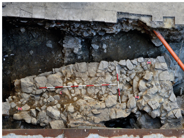
Obr. 78. Olomouc, Na Hradě. Zbytky kamenné severní zdi a severovýchodního nároží tzv. Juliánské věže, celkový pohled do sond S21/17 a S26/17.

Fig. 78. Olomouc, Na Hradě. Remnants of northern stone wall and NE corner of Julian Tower, general view of test pits S21/17 and S26/17.