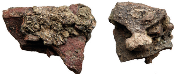
Obr. 69. Loštice, Pivovarská ulice. Zlomky spečené loštické keramiky.

Abb. 68. Loštice, Pivovarská Straße. Messer (1), spät-mittelalterliche (4, 6–8) und neuzeitliche Keramik (2, 6).