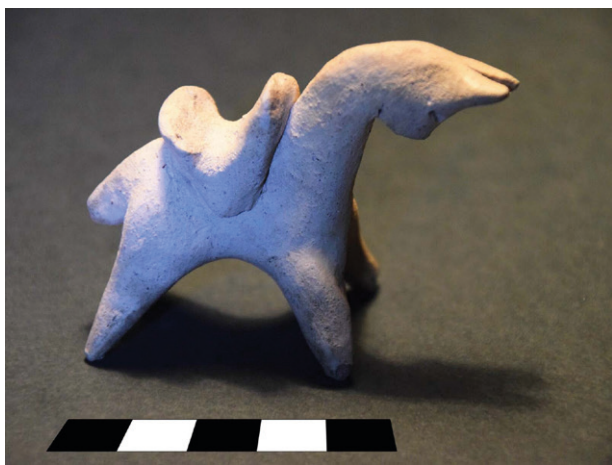
Obr. 67. Litovel. Keramická plastika konička.

Litovel (Olomouc District). A rescue archaeological excavation was conducted in the summer of 2017 in the historic center of Litovel city. Medieval cultural layers and remains of wooden constructions were documented in the trench (mid-13 th century – first half of 15 th century).