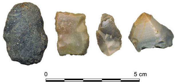
Obr. 59. Jihlava, Pelhřimovská. Kolekce kamenných štípaných artefaktů.

Fig. 58. Jihlava, Pelhřimovská Street. An Austro-Hungarian Cross of Merit and other military objects associated with nearby training grounds and a military base from the second half of 19th century.