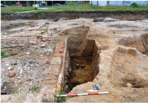
Obr. 56. Jihlava, Na Dolech. Snímek středověkého suterénu, narušeného základy dělnického domku z 20. století.

Fig. 56. Jihlava, Na Dolech. The cellar from the 13 th century, disturbed by workers' colony house from 20 th century.