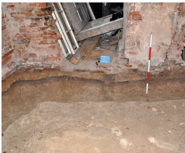
Obr. 51. Jihlava. Havířská 6. Pochozí horizont středověkého dvorku, dochovaný uvnitř domu v místnosti 106.