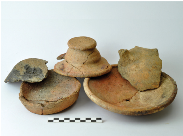
Obr. 57. Jihlava, Na Dolech. Výběr keramiky z jednoho ze suterénů.

Fig. 56. Jihlava, Na Dolech. The cellar from the 13 th century, disturbed by workers' colony house from 20 th century.