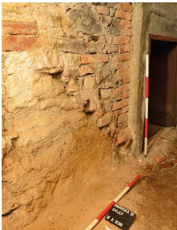
Obr. 53. Jihlava. Havířská 6. Pohled na relikv středověkého schodiště do sklepa pod místností 103 recentního domu. Dobře patrné jsou zbytky schodových stupňů zasekaných do rostlého podlaží. Vpravo vstup do nižší úrovně sklepení.

Fig. 53. Jihlava. Havířská Street 6. The relics of the medieval staircase to the cellar under the room No. 103 of the recent house. The remains of stair steps starved into the bedrock are well visible.