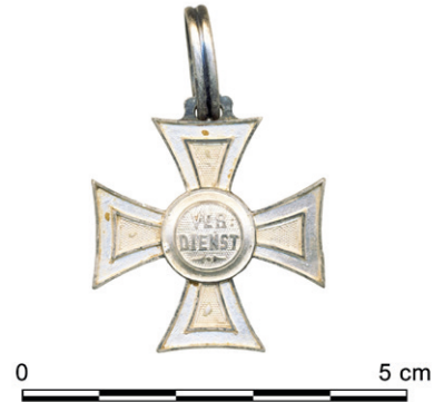
Obr. 58. Jihlava, Pelhřimovská. Nález rakouského záslužného kříže i dalších militárií souvisí patrně s provozem blízkých kasáren a přilehlého cvičiště v 2. polovině 19. století.

Kromě množství osobních předmětů a ozdob zaujme bohatý soubor olovených plomb domácí i zahraniční proveniencie, závaží i mincí. Soubor doplňují četná militária z období Rakouska-Uherska, která spojujeme s provozem nedalekých kasáren na dnešní ulici Vrchlického a přilehlého cvičiště. Neobvyklým nálezem je skupina tří kusů štípané kamenné industrie, pravděpodobně jde o křesací kameny (obr. 59).