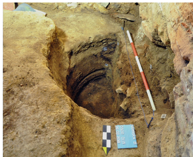
Obr. 52. Jihlava. Havířská 6. Jímka 0500 v průběhu exkavace. Na stěně jsou patrné otisky konstrukce dřevěného sudu, který tvořil vnitřní výztuž.