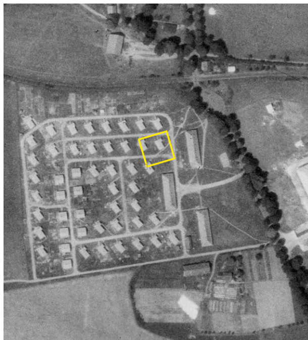
Obr. 54. Jihlava, Na Dolech. Letecký snímek z r. 1953 s vyznačenou plochou výzkumu. Dobře patrná je nově vystavěná kolonie dělnických domků, která nahradila budovy válečného pracovního tábora (upraveno dle https://kontaminace.cenia.cz ).

Předstihový záchranný archeologický výzkum odhalil další úsek středověké důlní aglomerace Staré Hory u Jihlavy (obr. 54). Na ploše budoucí mateřské školy se nacházela série těžebních i zkušebních šachet, zpracovatelské objekty a především čtyři zahloubené suterény obytných staveb se vstupní šíjí (obr. 55, 56). Archeologické situace doprovázel bohatý soubor keramiky a strusek doplněný fragmenty skleněných nádob, zlomkem kupeckých vah, souborem osobních předmětů a také odpadem z výroby mlecích kamenů (obr. 57). Nově byla věnována pozornost také mladším archeologickým situacím, konkrétně pozůstatkům pracovního tábora z let 1943–1945 a dělnické kolonie továrny Motorpal z 50. let 20. století, které se v zájmové oblasti nacházely (Těsnohlídek 2019a).