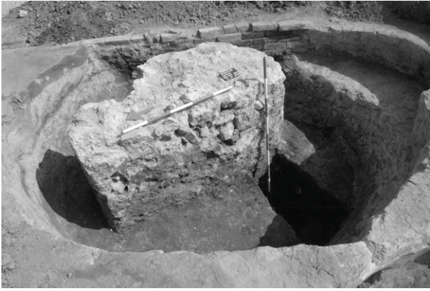
Obr. 41. Drnholec – Lidická ulice. Kamenocihelný pilíř s půdorysem ve tvaru „L“ z vrcholného středověku. Cihlová konstrukce v pozadí je novověká.

Fig. 41. Drnholec – Lidická Street. Brick-stone pillar with L-shaped ground plan from the high Middle Ages. Brick construction in the background is dated to the Modern Ages.