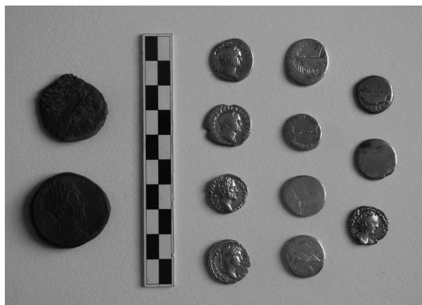
Obr. 9. Sudice. Mince z depotu.

Sudice (Bez. Blansko), „Vejšťice“. Münzendept. Oberflächensammlung mit Metalldetektoren. Rettungsgrabung.