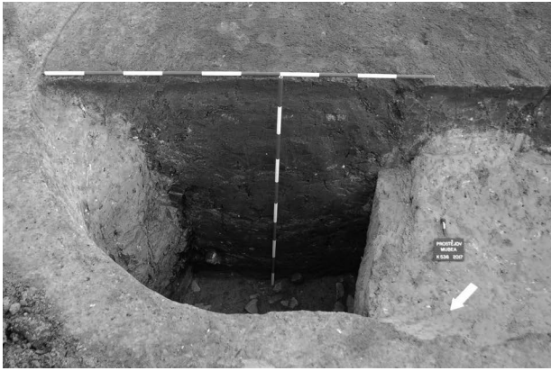
Obr. 6. Prostějov. Studna (obj. č. 536/2017).

Abb. 6. Prostějov. Brunnen (Obj. Nr. 536/2017).