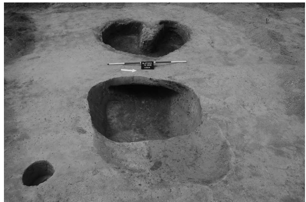
Obr. 8. Slatinice. Hrnčířská pec (obj. č. 504/2018).

Slatinice (Bez. Olomouc), „Trávníky“, Parz. Nr. 615/137, 615/138 und 615/139. Römische Kaiserzeit. Siedlung. Rettungsgrabung.