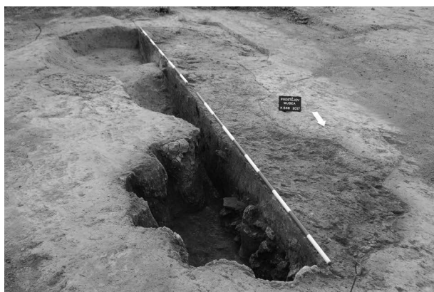
Obr. 4. Prostějov. Hrnčířská pec (obj. č. 546/2017).

Abb. 3. Prostějov. Töpferofen (Obj. Nr. 504/2017).