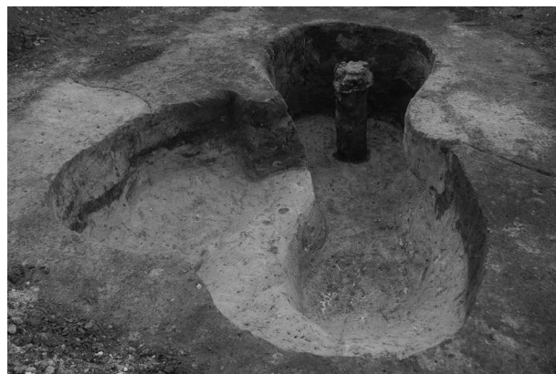
Obr. 5. Prostějov. Hrnčířská pec (obj. č. 722/2018).

Abb. 4. Prostějov. Töpferofen (Obj. Nr. 546/2017).