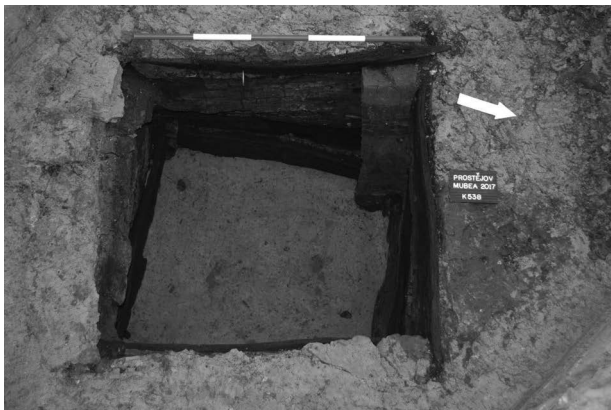
Obr. 7. Prostějov. Studna (obj. č. 538/2017).

Abb. 6. Prostějov. Brunnen (Obj. Nr. 536/2017).