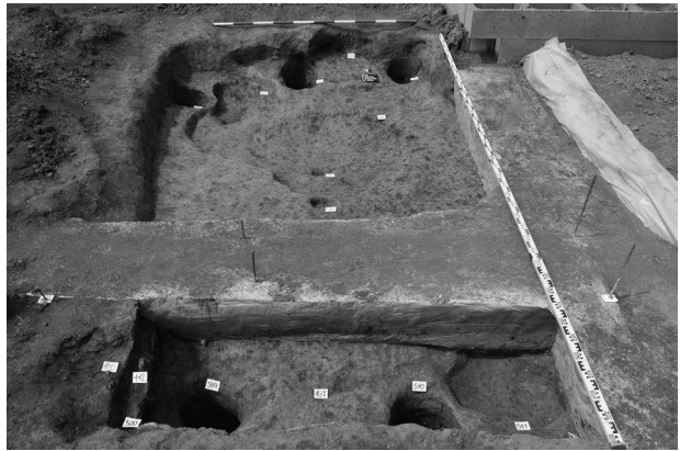
Obr. 2. Oldřišov. Půdorys prozkoumané zahloubené chaty (obj. č. 500).

Oldřišov (Bez. Opava), „Na plštské cestě“, U Naplatek Str. Römische Kaiserzeit. Siedlung. Rettungsgrabung.