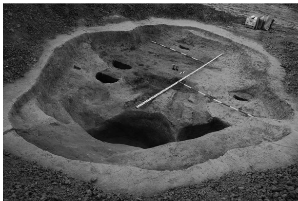
Obr. 5. Napajedla, „Dolní Padělky“. Pohled na laténský objekt s relikty hrnčířských dvoukomorových pecí.

Napajedla (Zlín District), „Dolní Padělky“. A late Iron age settlement was finally localized south of the Gienger company area in the route of the planned D55 highway. The presence of the settlement was signaled by isolated finds in the past. An important finding is the pottery workshop, a part of the newly discovered settlement.