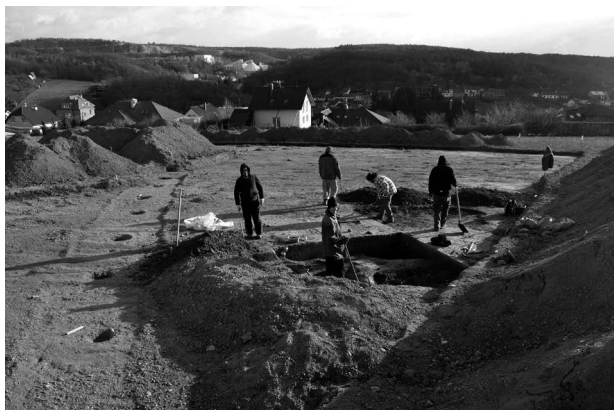
Obr. 4. Mokrá-Horákov, Dlouhé Kopaniny. Dvorec z doby halštatské.

Mokrá-Horákov (Kat. Mokrá u Brna, Bez. Brno-venkov), „Dlouhé Kopaniny“. Hallstattzeit, Herrenhof. Rettungsgrabung.