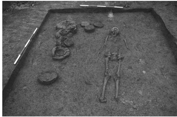
Obr. 3. Kuřim (okr. Brno-venkov). Komorový hrob. Abb. 3. Kuřim (Bez. Brno-venkov). Kammergrab.

Kuřim (Bez. Brno-venkov), Knínická Straže. Hallstattzeit. Gräberfeld. Rettungsgrabung