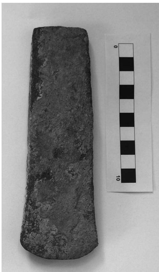
Obr. 9. Rýmařov, k. ú. Ondřejov u Rýmařova. Měděná sekera.