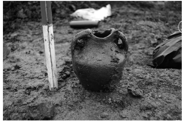
Obr. 3. Holešov, k. ú. Všetuly, Kompletní dvouuchá nádoba jordanovské kultury (objekt K506).

Fig. 2. Holešov, Všetuly Cadastre, A closer look to one of excavated wells with a central shaft.