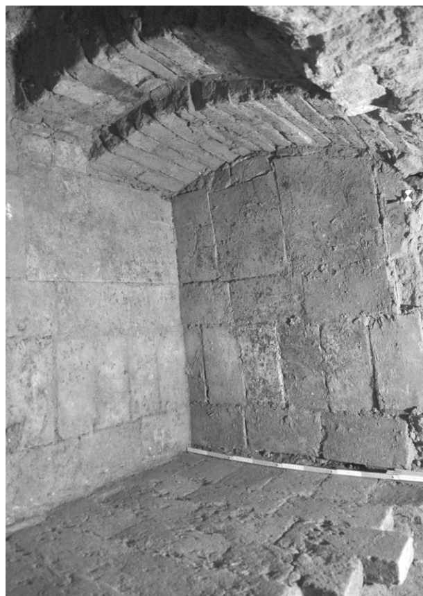
Obr. 79. Telč, Náměstí Zachariáše z Hradce 48. Snímek skladu hrnčířské hlíny obložený keramickými deskami.

Fig. 78. Telč, Náměstí Zachariáše z Hradce 48 (Square). A ceramic mould with 1686 dating; below: grinding stone from pottery workshop.