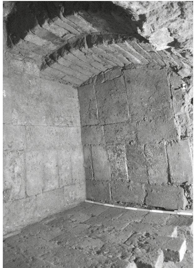
Obr. 79. Telč, Náměstí Zachariáše z Hradce 48. Snímek skladu hrnčířské hlíny obložený keramickými deskami.

Fig. 78. Telč, Náměstí Zachariáše z Hradce 48 (Square). A ceramic mould with 1686 dating; below: grinding stone from pottery workshop.