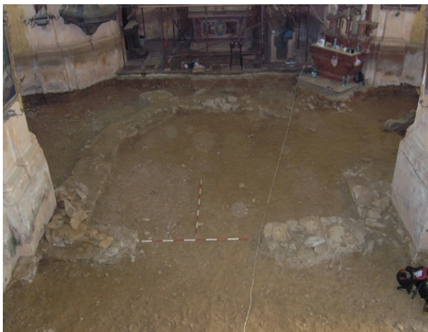
Abb. 75. Rejchartice, St.-Michael-Kirche. Freigelegte Fundamente der älteren Kirche und der neue Grundriß.

Obr. 76. Rejchartice, kostel svatého Michala. Celkový odhalený půdorys, foceno od západu shora z kruchty.