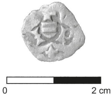
Obr. 68. Náměšť na Hané. AR štýrský fenik Friedricha III.