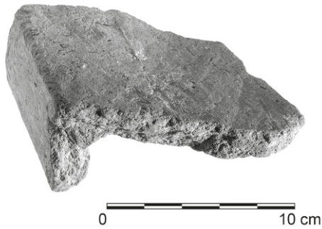
Obr. 71. Olomouc, Křížkovského 10, zlomek střešní krytiny s okrajem z objektu 2578. Foto M. Ondrušková.

Abb. 71. Olomouc, Křížkovského Gasse Nr. 10, das Fragment einer Dachziegel aus der Grube Nr. 2578. Foto M. Ondrušková.