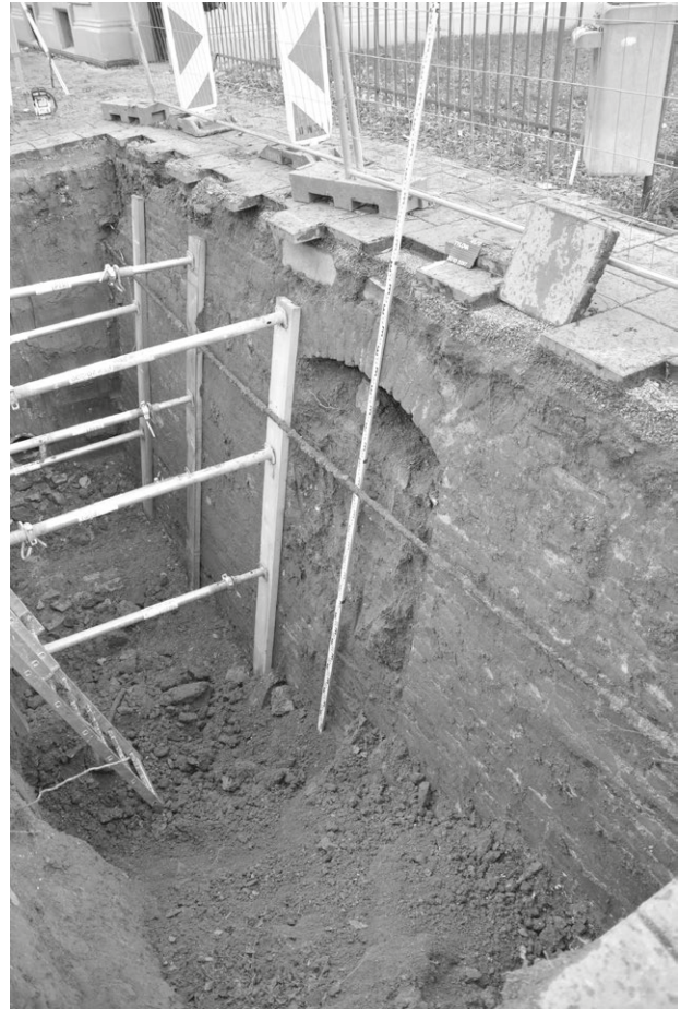
Obr. 72. Olomouc, Tylova, líc bastionu X od jihovýchodu.

Olomouc (Kat. Olomouc-město, Bez. Olomouc), Tylova Straße, Neuzeit. Festung – Bastion Nr. X. Rettungsgrabung.