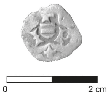
Obr. 68. Náměšť na Hané. AR štýrský fenik Friedricha III.