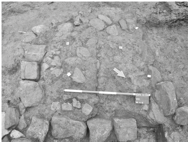
Obr. 61. Snímek základů jedné z pecí předlokačního sídliště v Kostelci u Jihlavy.

Kostelec and Dolní Cerekev (Kostelec u Jihlavy cadastre and Dolní Cerekev Cadastre, Jihlava District), northern edge of the town. Early settlement in Kostelec u Jihlavy, 1 st half of 13 th century, dendrochronological sample dated to 1206 AD, manufacturing area, kilns, sawdust and pottery from medieval sawhouse (?) by the river. Rescue excavation.