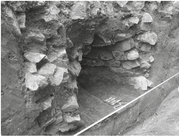
Obr. 58. Jihlava, ulice Na Dolech. Snímek pyrotechnologického zařízení, zdokumentovaného při rekonstrukci železničního přejezdu na Starých Horách v Jihlavě.

Fig. 58. Jihlava, Na Dolech Street. Photo of pyrotechnological kiln, documented at reconstruction of railway crossing at "Staré Hory", Jihlava.