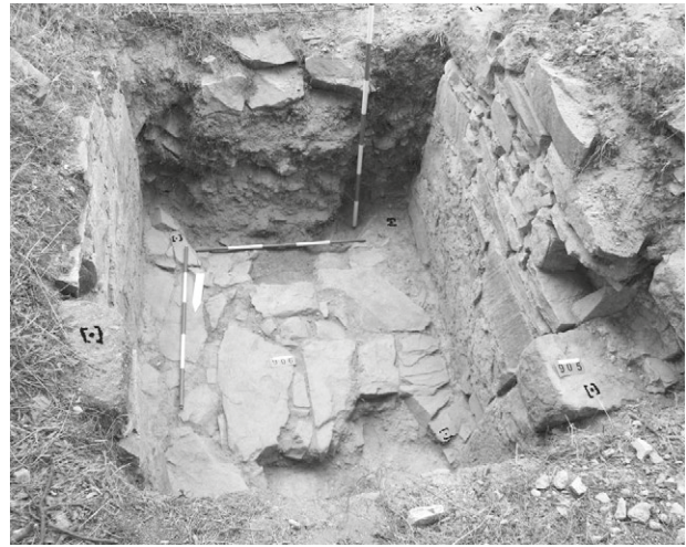
Obr. 52. Jamolice, Hrad Templštejn. Sonda S2, Pohled na dlažbu ve vstupu do jádra. Vpravo patrná kapsa po závoře.

Abb. 50. Jamolice, Burg Templštejn. Lage der Grabungsschnitte im Burgareal.