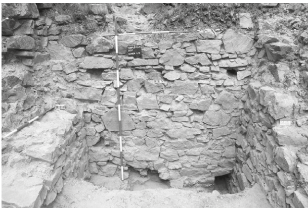
Obr. 51. Jamolice, Hrad Templštejn. Sonda S1/A. Pohled na čelo brány. Vpravo dole odvodňovací kanálek. Nahore druhotně zazděné kapsy.

Abb. 52. Jamolice, Burg Templštejn. Grabungsschnitt S2. Blick auf den Pflaster im Eingang in den Schloßkern. Rechts die Riegeltasche sichtbar.