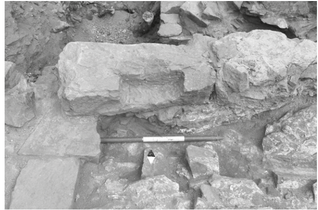
Obr. 9. Bílovec, zámek. Jedna z točnic padacího mostu vytesaná z pískovce.

Abb. 7. Bílovec, das Schloss. Fragment einer Spolie (Türgewände), der in den barockzeitigen Planierschichten gefunden wurde.