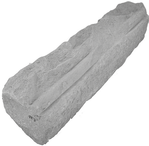
Obr. 7. Bílovec, zámek. Fragment renesančního stavebního článku (ostění) nalezený v barokních stavebních planýrkách. Foto J. Tůmová.

Abb. 7. Bílovec, das Schloss. Fragment einer Spolie (Türgewände), der in den barockzeitigen Planierschichten gefunden wurde. Foto J. Tůmová.