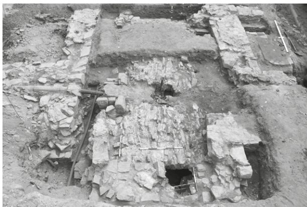
Obr. 8. Bílovec, zámek. Archeologicky odkryté pozůstatky branské věže, pohled od západu. V popředí vysunutá mostnice s dvojicí točnic padacího mostu, v interiéru původní šachtice pro dojezd padacího mostu druhotně vložená kamenná klenba.

Předpokládáme, že v době svého vzniku kostel představoval, snad s přilehlým dvorcem, oporu biskupských držav na Blanensku a byl středem osady, kterou dnes označujeme jako Staré Blansko. To se patrně rozkládalo bezprostředně okolo něho. Někdy ve druhé půli 13. století pak došlo k přesunu vrchnostenského sídla na nedaleký hrad Blansek a také osada se pravděpodobně částečně přesunula do míst dnešního středu