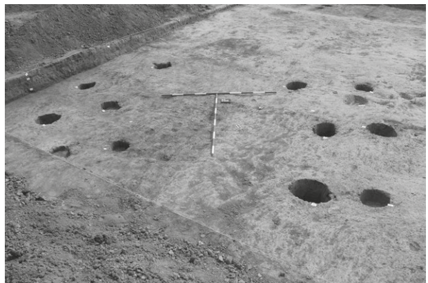
Obr. 9. Vávrovice. Zahloubená chata č. 2/3 (obj. č. 546).

Abb. 8. Vávrovice. Grubenhäuser Nr. 1 (Objekt Nr. 516).