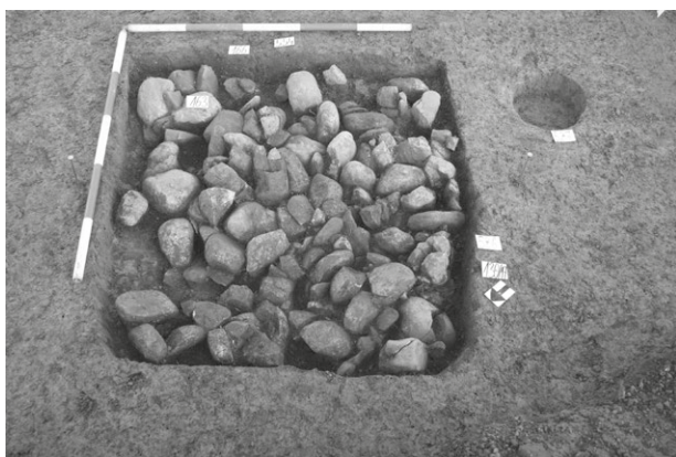
Obr. 6. Oldřišov. Zahloubená chata (obj. č. 500). Abb. 6. Oldřišov. Grubenhaus (Objekt Nr. 500).