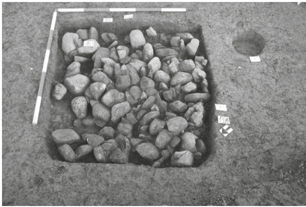
Obr. 6. Oldřišov. Zahloubená chata (obj. č. 500).

Abb. 5. Oldřišov. Quadratische Grube (Objekt Nr. 526).