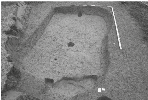
Obr. 7. Oldřišov. Zahloubená chata (obj. č. 523).

Abb. 6. Oldřišov. Grubenhaus (Objekt Nr. 500).