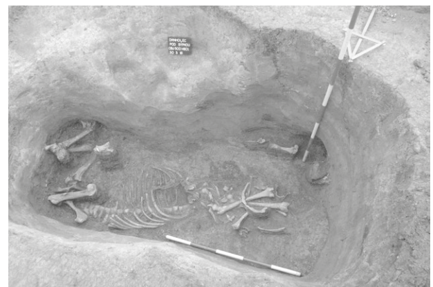
Obr. 3. Drnholec, „Pod Sýpkou“. Hrob H 801, pohřeb muže s mulou.

Drnholec (Břeclav District), “Pod Sýpkou”. Discovery of a new graveyard from the Migration Period during construction of family houses. Seven Longobard graves were excavated so far.