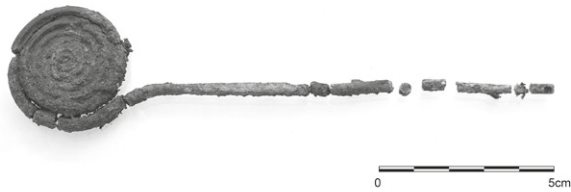
Obr. 12. Slavkov. Bronzová jehlice před konzervací. Foto J. Tůmová.

Abb. 12. Slavkov. Bronzenadel vor Konservierung. Foto J. Tůmová.