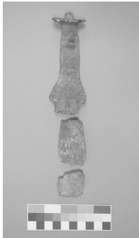
Obr. 13. Šakvice, „Kopce“. Bronzový meč liptovského typu.

Šakvice (Břeclav District), „Kopce“, Land Registry No. 3369. Bronze sword of Liptov type. Velatic culture. Isolated artefact.