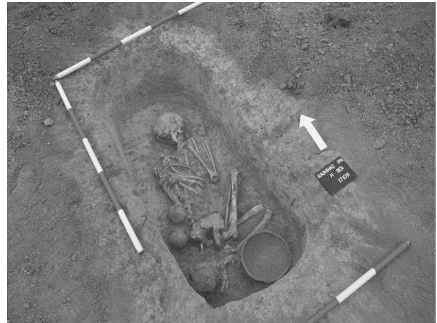
Obr. 10. Rajhrad, objekt H801. Kostrový hrob z období kultury se zvoncovitými poháry.

Rajhrad (Brno-venkov District), “U Staré Pošty”. During the archaeological rescue research the Bell Beaker culture graves were excavated.