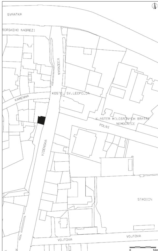
Obr. 1. Brno, Vídeňská 16. Lokalizace výzkumu.

Brno (Kat. Štýřice), Vídeňská-Straße, Parz. Nr. 681 (Aktion A032/2017). Neolit, MBK. Siedlung. Rettungsgrabung.