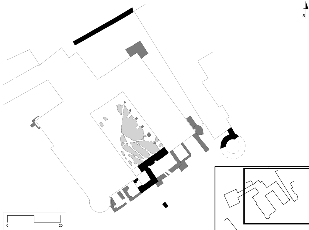
Obr. 54. Strážnice – zámek, část výzkumem zachycených historických konstrukcí. Černě – středověké zdivo, šedě – novověké zdivo, zcela šedě – dlažba nádvoří.

Abb. 53. Strážnice – bytový dům, Lokalisierung der Grabungstelle.