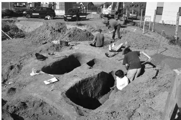
Obr. 46. Podolí, „Nad cihelnou“, okr. Brno-venkov. Výzkum pohřebiště.

Podolí (Bez. Brno-venkov), „Nad cihelnou“. Frühmittelalter, Mittelburgwallzeit. Gräberfeld. Rettungsgrabung.