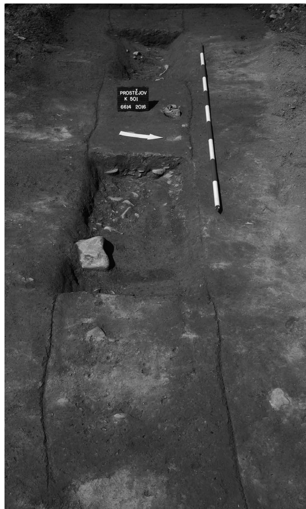
Obr. 51. Prostějov, k. ú. Čechovice u Prostějova, okr. Prostějov, „Díly u Hloučely“. Zbytky novověké vozové cesty. Abb. 51. Prostějov, Kat. Čechovice u Prostějova, Bez. Prostějov, „Díly u Hloučely“. Neuzeitliche Fahrwegreste.

Prostějov (Kat. Čechovice u Prostějova, Bez. Prostějov), „Díly u Hloučely“, Parz. Nr. 369/8, 546/1. Neuzeit. Wagenweg. Rettungsgrabung.