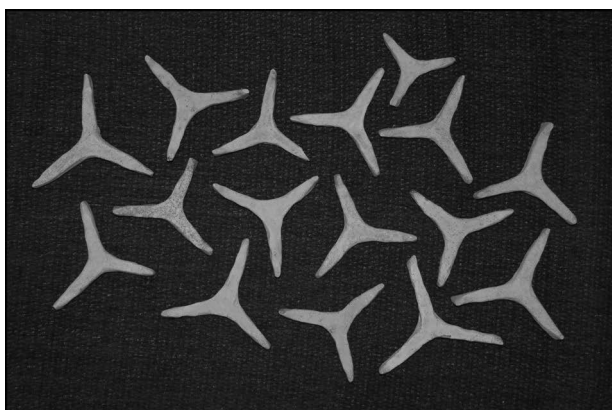
Obr. 48. Prostějov, okr. Prostějov, ulice Vodní. Nezbytná toufarská pomůcka, tzv. „krédl“, sloužící k oddělování nádob při výpalu.