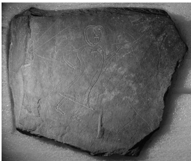
Obr. 41. Olomouc, Křížkovského 10, břidlicová destička s rytinou z objektu 2527.