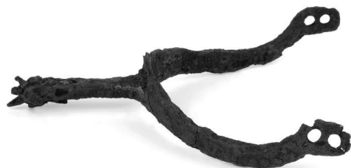
Obr. 31. Mutkov. Železné ostruhy.

Abb. 31. Mutkov. (Bez. Olomouc). Eisen Sporen.