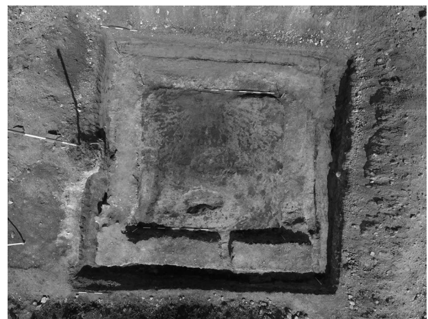
Obr. 23. Křenovice, „Přední“. Půdorys šibenice.

Lidské i ojedinělé zvířecí kosti se našly v neanatomické poloze. Jednalo se minimálně o 15 lidských jedinců, z čehož byl minimálně jeden ženského pohlaví. Při odkryvu pozůstatků šibenice se našly nepříliš četné zlomky keramiky. Kromě pěti zlomků, které pocházejí patrně z nádob pravěkého či raně středověkého stáří, jsou ostatní zlomky rámcově novověké. Nalezená spínadla, sestávající z drátěného háčku a očka, nalezená v areálu slavkovské šibenice v počtu čtyř háčků a jednoho háčku s očkem, byla běžnou součástí oděvů od 15. století. Dále se našly dva hřebíky s příčnou hlaví, které bývaly patrně součástí konstrukce šibenice, část podkovy, kruhová zděř, dva zlomky skla pochá-