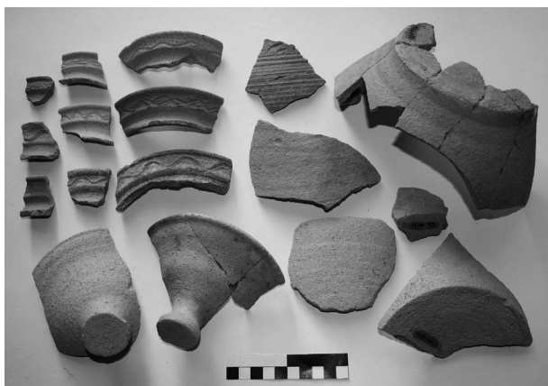
Obr. 20. Horní Suchá (okr. Karviná). Výběr keramických nálezů.

Horní Suchá (Bez. Karviná), Pěší Straže, Mittelalter, Schicht. Rettungsgrabung.