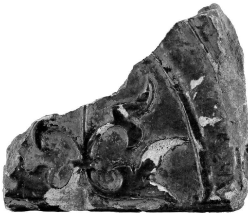
Obr. 17. Drahanovice. Fragment kachle.

Drahanovice (Bez. Olomouc). Intravillan. Feste. Hochmittelalter. Neuzeit. Oberflächensammlung.